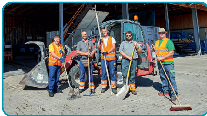
Unsere Mitarbeiter wurden eine Woche von Leiharbeitskräften unterstützt.

Die Öffnungszeiten des Altstoffsammelzentrums im Herbst: Samstag von 10 bis 12 Uhr Mittwoch von 16 bis 18 Uhr