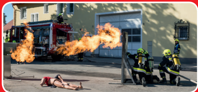
Einsatzübung am Eröffnungstag des Florianiheurigen