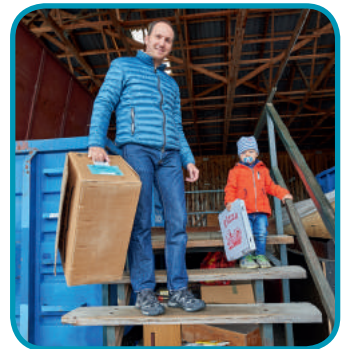
Oft sind die „Kleinen“ durch Schule und Kindergarten bestens über die richtige Mülltrennung informiert.