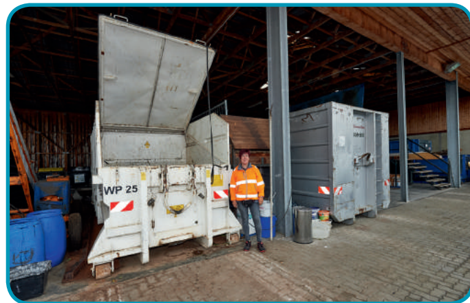
Was in den Sperrmüllcontainer kommt, wird streng überwacht. Bitte dies nicht als Schikane zu sehen! Der Sperrmüll verursacht die höchsten Kosten aller Stoffe. Achtlos eingeworfenes Holz erzeugt Kosten, die im Altholzcontainer viel niedriger wären.