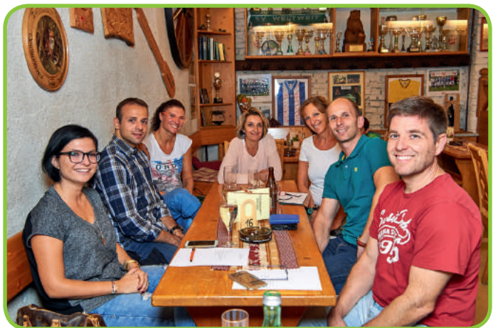
Unser Trainerteam ist qualifiziert und zertifiziert.