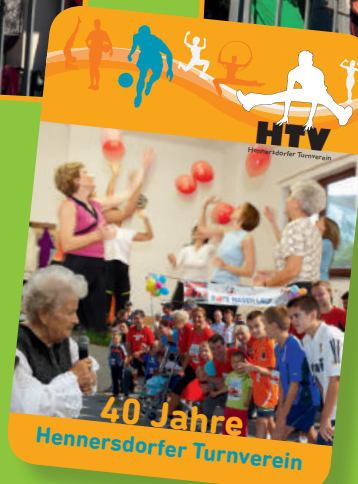
Zu unserem 40-Jahr-Bestehen haben wir eine reich bebilderte Festschrift aufgelegt. 2019 feiern wir unser 50-Jahr-Jubiläum! Das wird ein Fest!