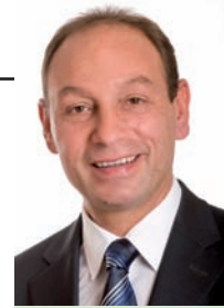
Gerhard Seban Bildungsgemeinderat und gf.GR für Bildung u. Gemeindepartnerschaften